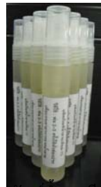
ผลิตภัณฑ์ทานายาเทียม