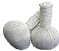
ลูกประคบและผลิตภัณฑ์สเปรย์บรรเทาปวด

ฐานข้อมูลตำรับยาสมุนไพรไทยนี้ ได้ถูกพัฒนาอย่าง ต่อเนื่อง ตั้งแต่ปี พ.ศ.๒๕๓๖ จนถึงปัจจุบัน รวมเวลามากกว่า ๒๐ ปี สามารถบันทึก แก้ไขและค้นหาข้อมูล โดยระบบให้ข้อมูลเชื่อมโยง กันได้จากหลายเงื่อนไข เช่น การค้นหาข้อมูลของโรคที่พบใน เอกสารตำรายาแต่ละเล่ม แต่ละจังหวัด การค้นหาข้อมูลทั้งโรคและ สมุนไพรที่ใช้รักษาจากหลายเล่ม หลายจังหวัด โดยสามารถแสดงผล การค้นหาในรูปแบบของรายงานที่ระบุข้อมูลที่สามารถนำไปใช้ ประโยชน์ในงานวิจัยได้อย่างมีประสิทธิภาพ จนถึงปัจจุบันมีงานวิจัย ที่ได้จากฐานข้อมูลตำรับยาสมุนไพร “มนโสร้อย ๑-๓” แล้วคือ ผลงานวิจัยที่ตีพิมพ์ ๑๔ เรื่อง สิทธิบัตร ๘ เรื่อง สารเดี่ยวจาก สมุนไพรมากกว่า ๓๐ ชนิด และสารใหม่ที่มีฤทธิ์ทางชีวภาพมากกว่า ๕ ชนิด นอกจากนี้ยังสามารถนำข้อมูลจากฐานข้อมูลนี้ไปวิจัยและ พัฒนาเป็นผลิตภัณฑ์ยา เสริมอาหาร และเครื่องสำอางที่มีศักยภาพ ในเชิงพาณิชย์ ในประการสำคัญจะเป็นการช่วยอนุรักษ์ภูมิปัญญา ไทยได้อีกทางหนึ่งด้วย