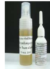
ผลิตภัณฑ์ป้องกันผมร่วง